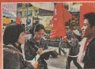
明愛徐誠斌學生認識世貿 23