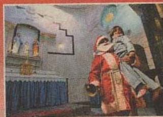
西班牙神父治療聖誕抑鬱症 21