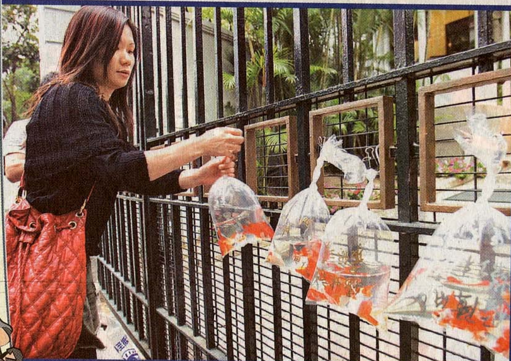
◆「七日貧窮人」的參加者將五十條金魚送到禮賓府，象徵香港有五十萬名月入少過五千元的打工仔。

本港貧富懸殊問題日趨嚴重，香港天主教勞工問題，舉辦了為期一周的「七天貧窮人」生活體驗，花費三百五十元，一嘗粗茶淡飯的滋味。參加港貧窮問題，促請政府投放更多資源扶貧，並禮賓府遞交請願信和五十條金魚，象徵本港有